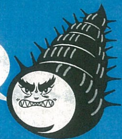
チェーン巻いたん貝