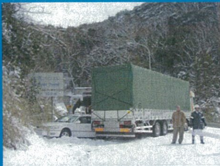
国道9号 鳥取県鳥取市気高町酒ノ津地先 平成23年1月30日