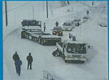
国道8号 新潟県柏崎市五十土地先 平成24年1月27日