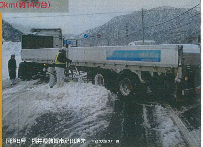
国道8号 福井県敦賀市疋田地先 平成23年2月1日

大型車のスリップ・立ち往生をきっかけに、 長時間の通行止めが発生しています。 冬用タイヤの交換・早めのチェーン装着を よろしくお願いします。