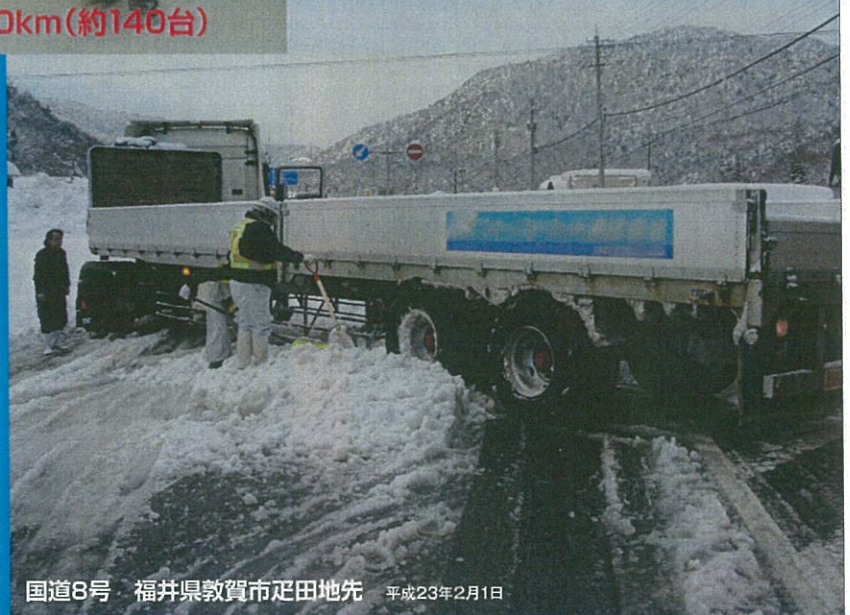
国道8号 福井県敦賀市足田地先 平成23年2月1日

大型車のスリップ・立ち往生をきっかけに、 長時間の通行止めが発生しています。 冬用タイヤの交換・早めのチェーン装着を よろしくお願いします。