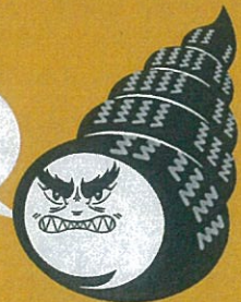
タイヤ換えたん員