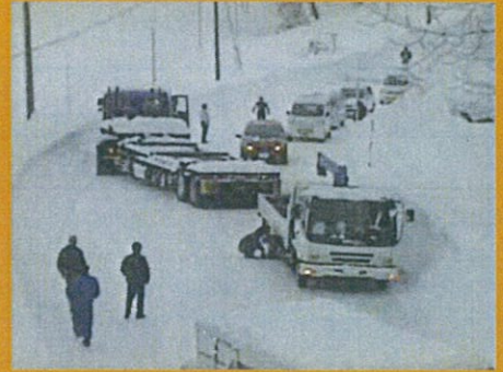
国道8号 新潟県柏崎市五十土地先 平成24年1月27日