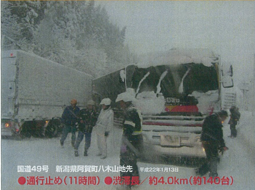
国道49号 新潟県阿賀町八木山地先 平成22年1月13日 ●通行止め(11時間) ●渋滞長/約4.0km(約140台)