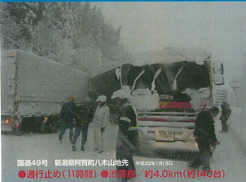
国道49号 新潟県阿賀町八木山地先 平成22年1月13日 ●通行止め(11時間) ●渋滞長/約4.0km(約140台)