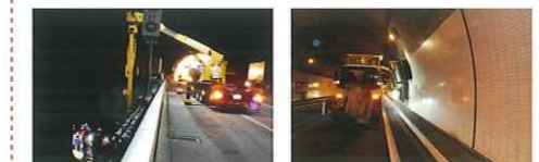
橋梁点検車を用いた橋梁下面および橋桁の点検 トンネルの側壁清掃