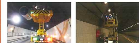
トンネルジェットファン点検 トンネル照明設備点検