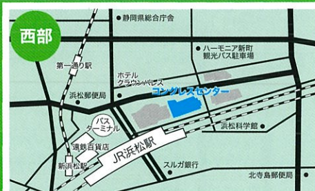
アクトシティ浜松コンgresセンター52~53会議室

沼津市大手町1-1-4 TEL:055-920-4100 □JR沼津駅北口より徒歩3分